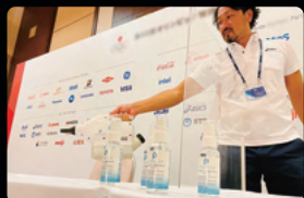
国際競技大会 2020 記者会見会場