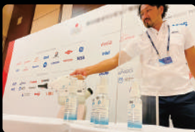
国際競技大会 2020 記者会見会場